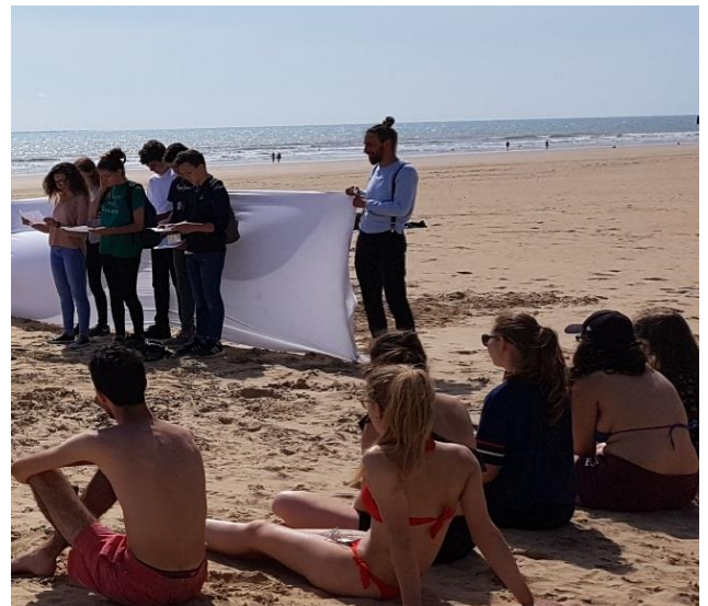
Lecture sur la plage centrale, Saint-Jean-de-Monts