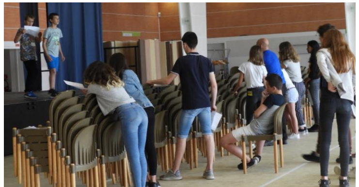
Ateliers de préparation des lectures réunissant jeunes et adultes