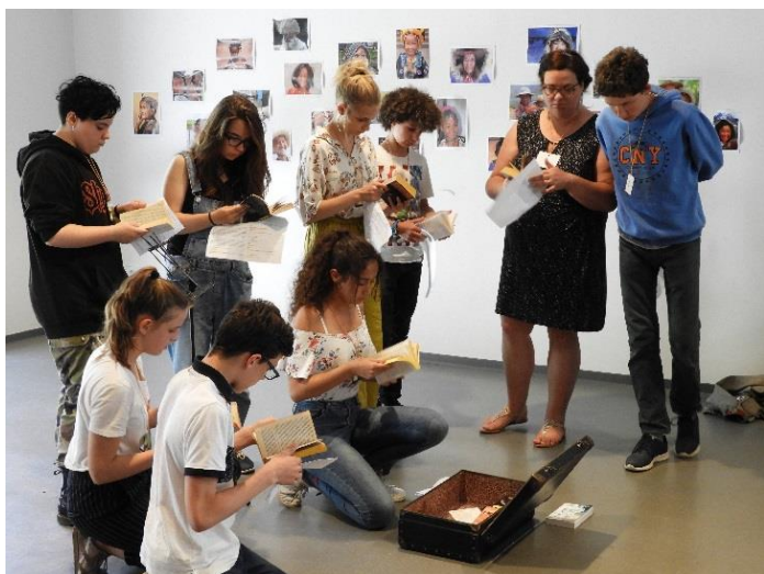
Lecture à l'EHPAD « La Forêt » Saint-Jean-de-Monts