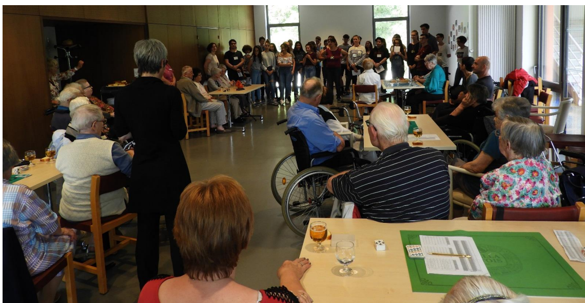
Temps d'échanges à l'EHPAD après la lecture

Les temps de lecture ont été suivis d'un temps d'échanges avec le public.