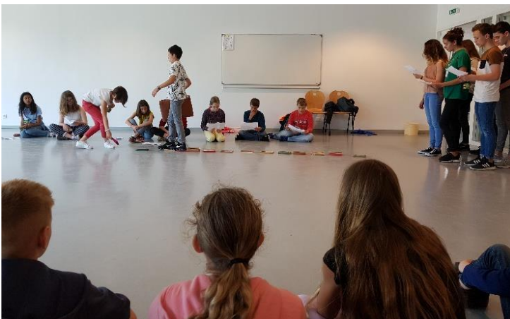
Lecture à l'école de la Plage, Saint-Jean-de-Monts